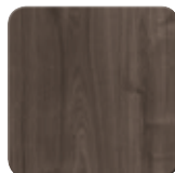
Marone Dekor Trüffel