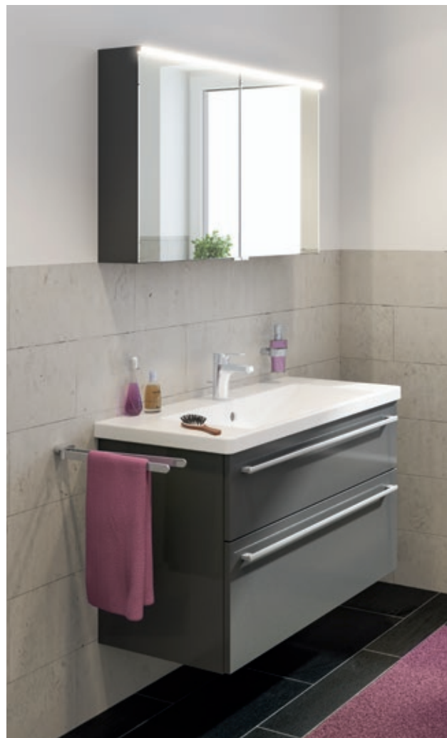
Optima L Badmöbel-Set in Anthrazit Hochglanz