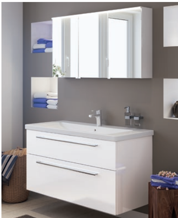
Optima L Badmöbel-Set in Weiß Hochglanz