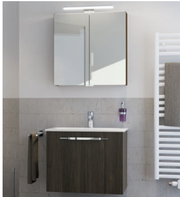
Optima S Badmöbel-Set in Marone Dekor Trüffel

Die Mineralguss- oder Keramikwaschtische haben eine schmutzabweisende Oberfläche und sind ebenso wie die Thermofronten der Unterschränke leicht zu reinigen. Die Optima Badmöbel bringen Form und Funktion auf den Punkt!