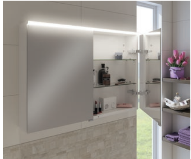
Optima L Spiegelschrank

Weiße Keramikwaschtische fügen sich harmonisch in das Gesamtbild ein. Spiegelschränke mit beidseitig verspiegelten Türen, viel Stauraum im Innern und einer modernen horizontale LED-Leuchte runden die Gesamtoptik perfekt ab.