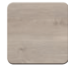
Eiche Dekor Flanelle