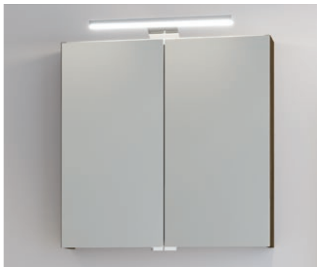
Optima S Spiegelschrank mit LED-Aufsatzleuchte

Die Mineralgusswaschtische haben eine schmutzabweisende Oberfläche und sind mit dem „Clou“ Ab- und Überlaufsystem für Waschtische ohne sichtbare Überlauföffnung ausgestattet. Die Spiegelschranktüren sind beidseitig verspiegelt und die Glaseinlegeböden höhenverstellbar. Ob in modernem Weiß oder in dunkler Holzoptik „Marone Dekor Trüffel“ – die Optima S Badmöbel sind auf jeden Fall ein Hingucker und werden von der LED-Aufsatzleuchte ins rechte Licht gerückt.