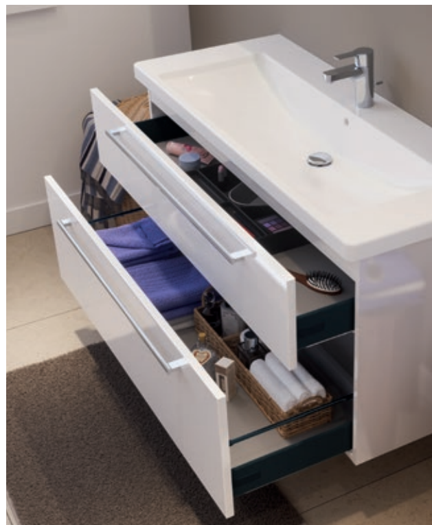
Optima L Unterschrank mit zwei Auszügen