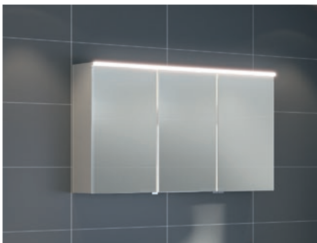
Optima L Spiegelschrank